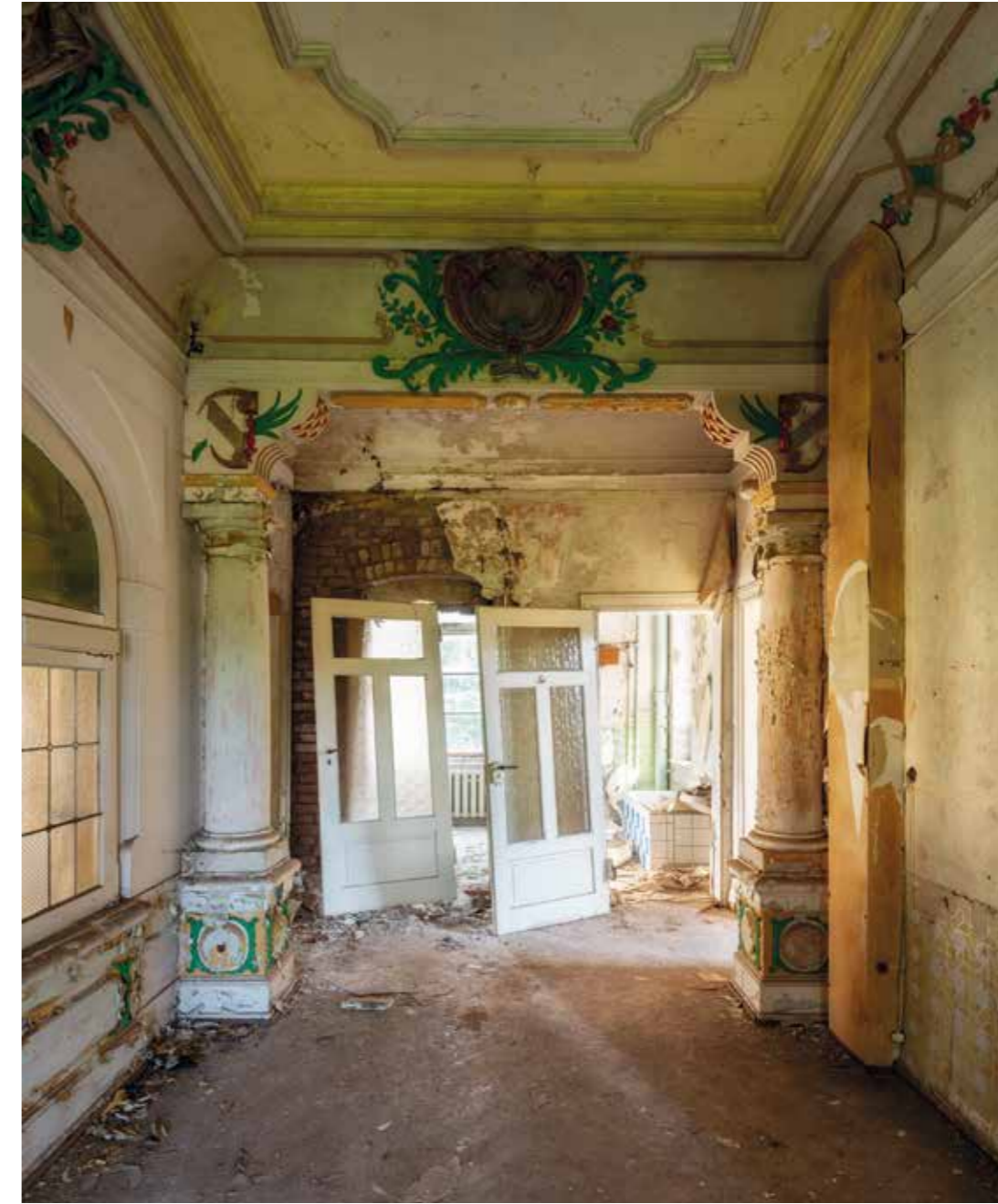
Manoir – Saxe – (2019)