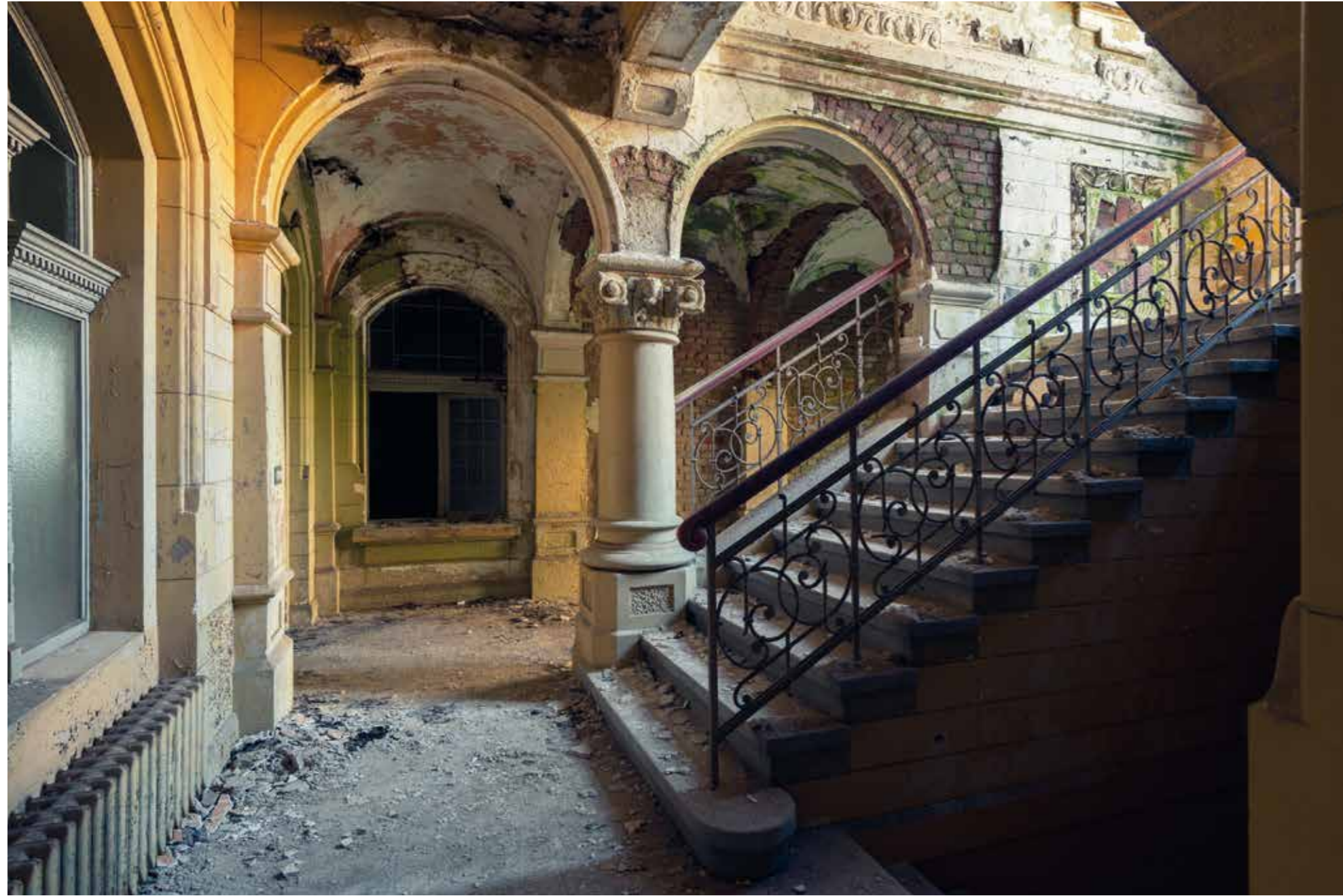
Manoir – Saxe – (2019)