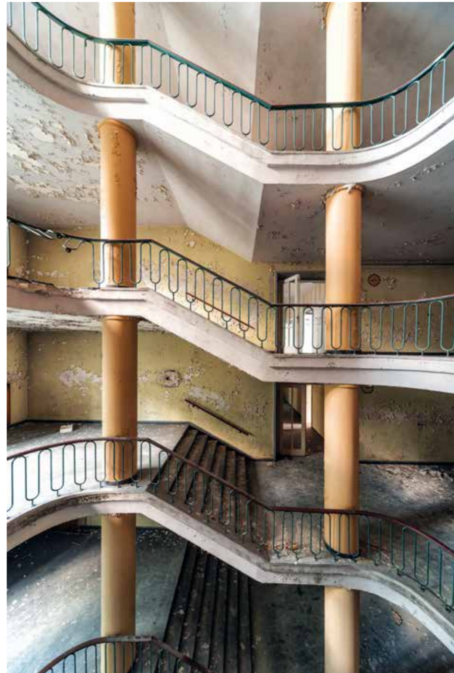
VEB Strömungsmaschinen Pirna – Saxe – (2013)