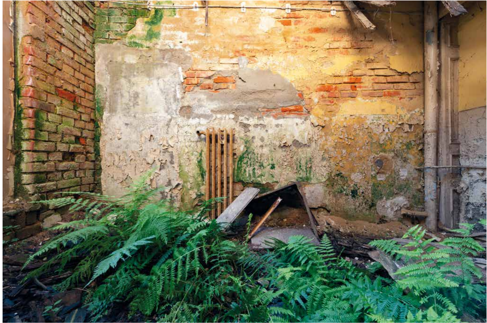
Hôtel - Brandebourg - (2019)