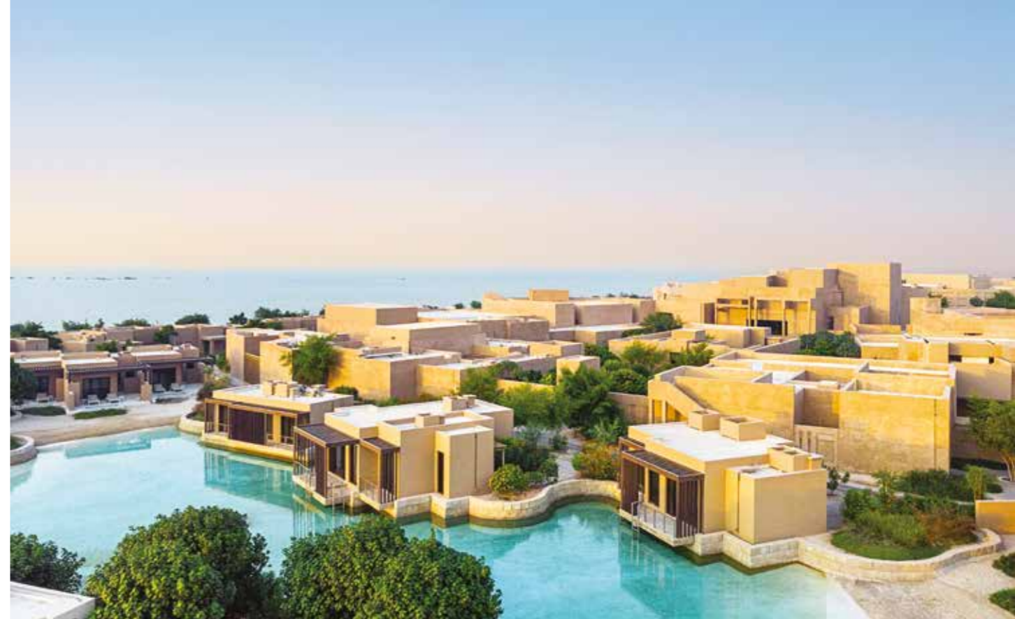
ZULAL WELLNESS RESORT, QATAR

reservations@chivasom.com (Thailand) reservations@zula.com (Qatar)