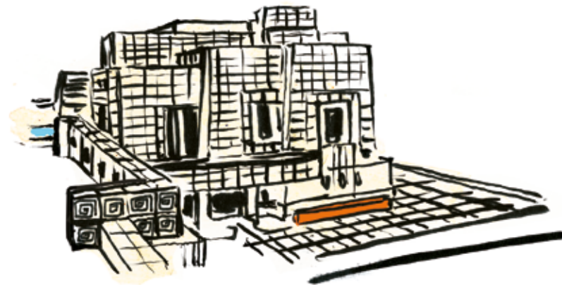
ENNIS HOUSE FRANK LLOYD WRIGHT - 1924