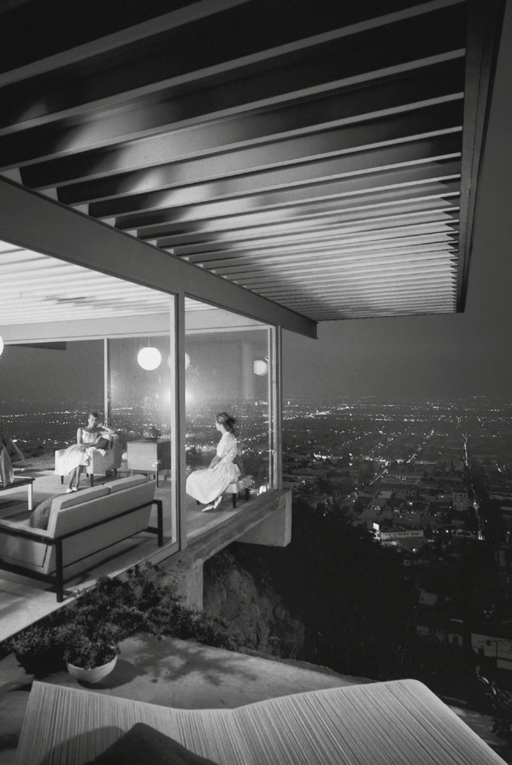
JULIUS SHULMAN © J. PAUL GETTY TRUST. GETTY RESEARCH INSTITUTE, LOS ANGELES (2004.R.1.0)