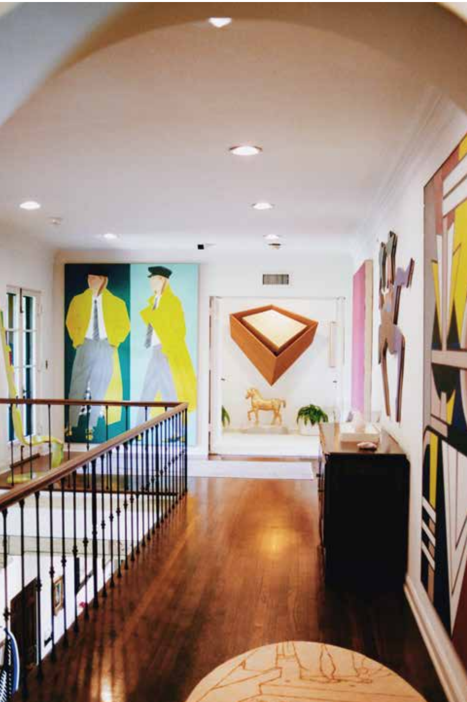
© PIA RIVEROLA - FREDERICK R. WEISMAN ART FOUNDATION, LOS ANGELES