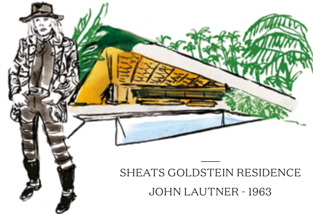
SHEATS GOLDSTEIN RESIDENCE JOHN LAUTNER - 1963