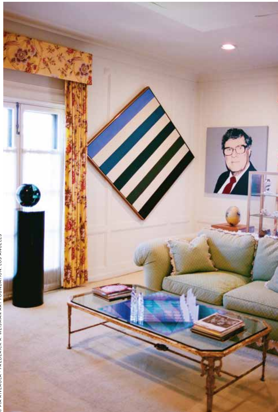
© PIA RIVEROLA - FREDERICK R. WEISMAN ART FOUNDATION, LOS ANGELES