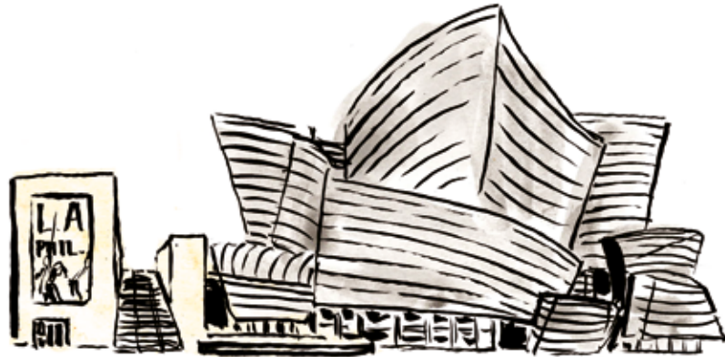
WALT DISNEY HALL FRANK GEHRY - 2003