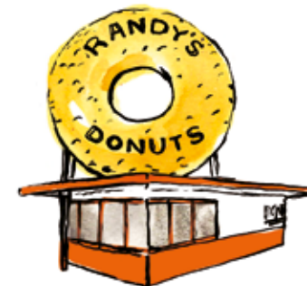
RANDY'S DONUTS HENRY J. GOODWIN - 1953