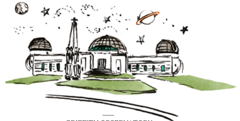
GRIFFITH OBSERVATORY JOHN C. AUSTIN - 1935