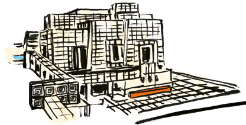
ENNIS HOUSE FRANK LLOYD WRIGHT - 1924