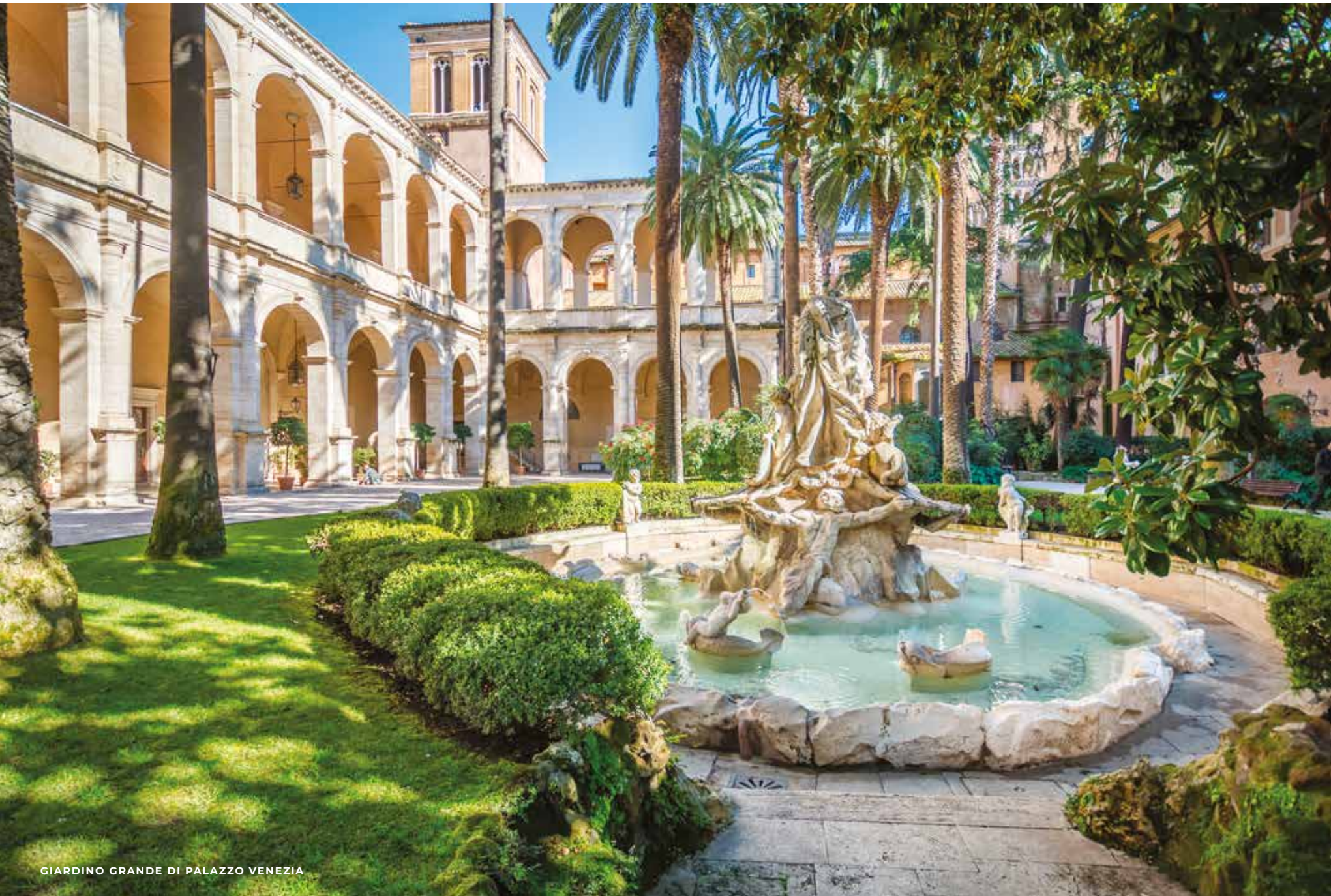
GIARDINO GRANDE DI PALAZZO VENEZIA